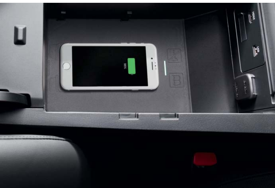
Caricabatterie wireless per smartphone

Mazda ha creato accessori dal design accattivante che si integrano perfettamente con la tua Mazda3 2022. Per scoprire tutti gli accessori originali Mazda per la tua Mazda3, visita il sito Mazda.it