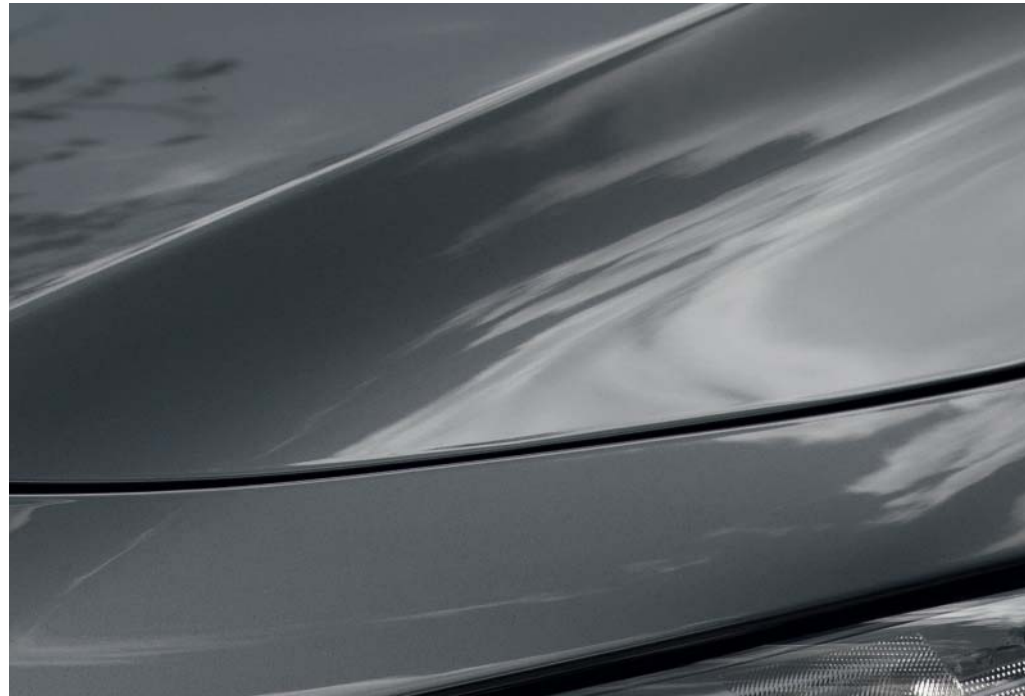
Machine Gray / Metallic

Vai su mazda.it per scoprire tutti i colori disponibili.