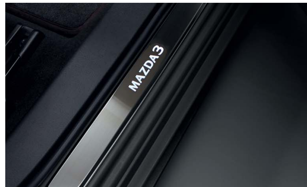
Battitacchi anteriori illuminati