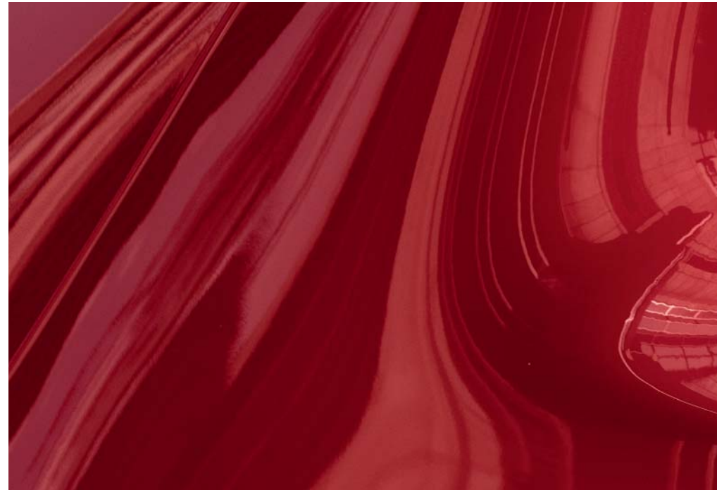
Soul Red Crystal